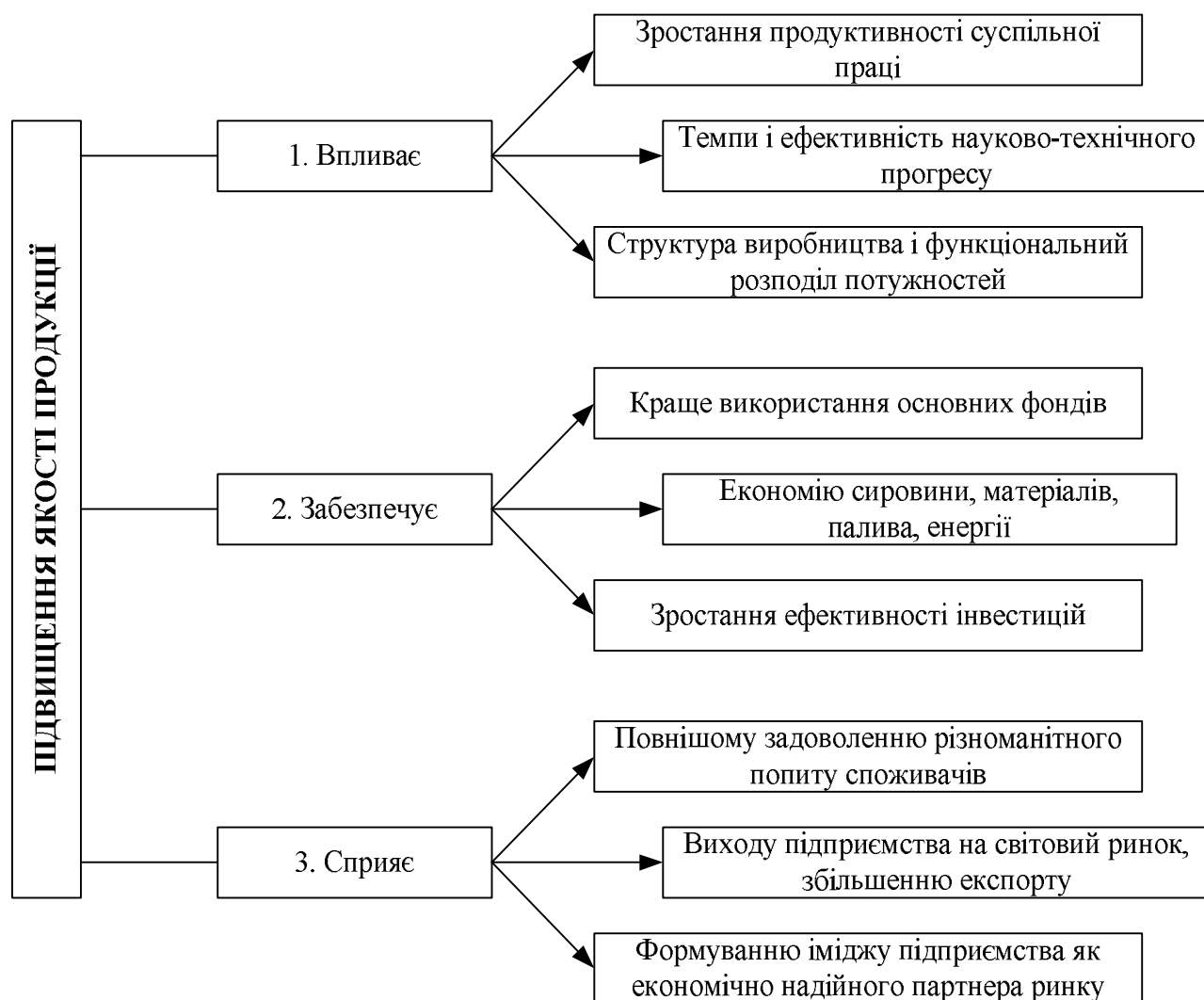
Рисунок 2 - Багатоспрямований вплив підвищення якості продукції на виробництво та імідж підприємства