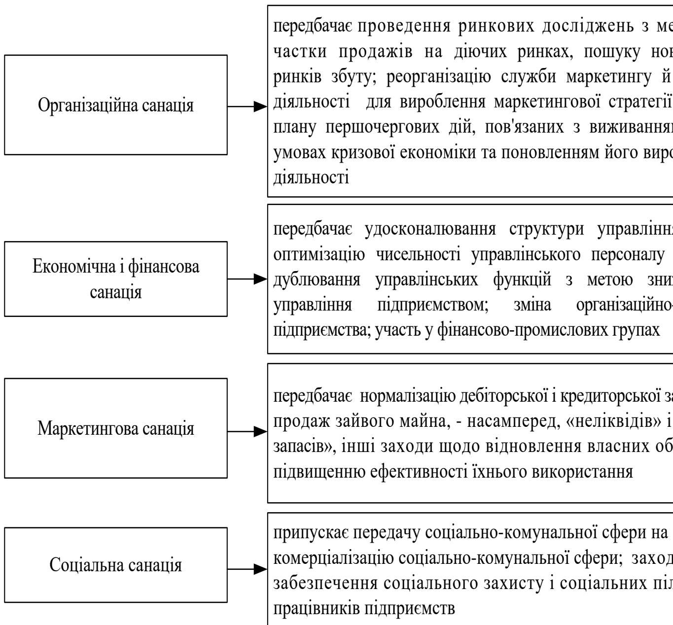
Рис. 3. Структура стратегії виживання

Ці стратегічні альтернативи тісно пов'язані із збереженням науково-технічного і кадрового потенціалу, які життєво необхідно для реалізації стратегії обмеженого росту, вироблюваної підприємством в умовах невизначеності і прогнозованого підйому його діяльності. Дана стратегічна альтернатива спрямована на підтримку «іміджу» підприємства і збереження колишніх позицій на ринку, з одного боку, і на зниження соціальної напруженості у внутрішній середовищі підприємства, з іншого.