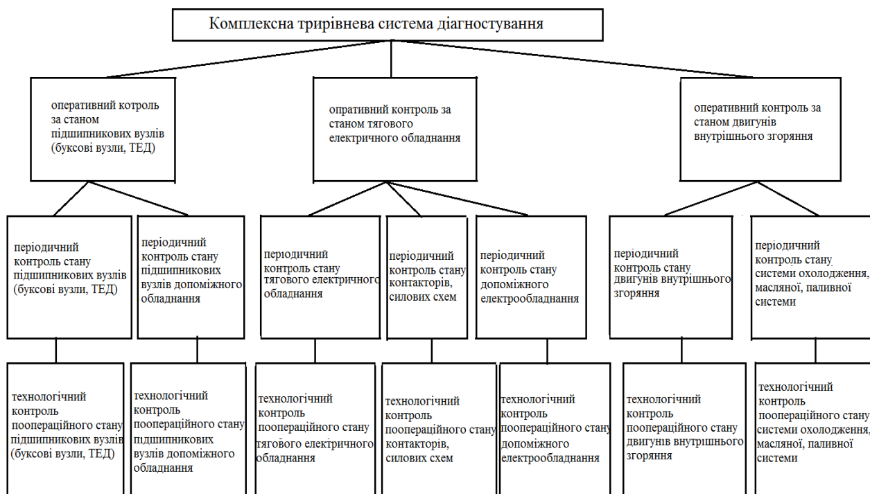
Рис. 2. Розширена структура комплексної тривірневої системи діагностування

Структура комплексної тривірневої системи діагностування локомотивів зображена на рис. 2.