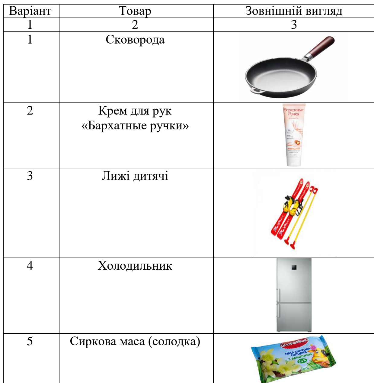
Таблиця 17 – Дані для виконання завдання

Завдання 5.4. Простежити вплив факторів формування товарних характеристик товарів та обґрунтувати найбільш важливі фактори для товарів (таблиця 17).