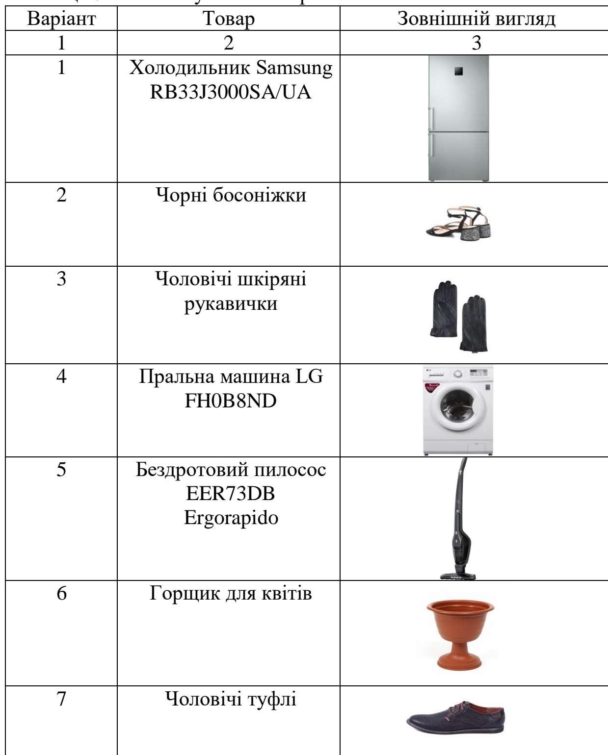
Таблиця 7 – Найменування товарів

Мета: виявити продукти, у яких закінчився термін реалізації або термін споживання.