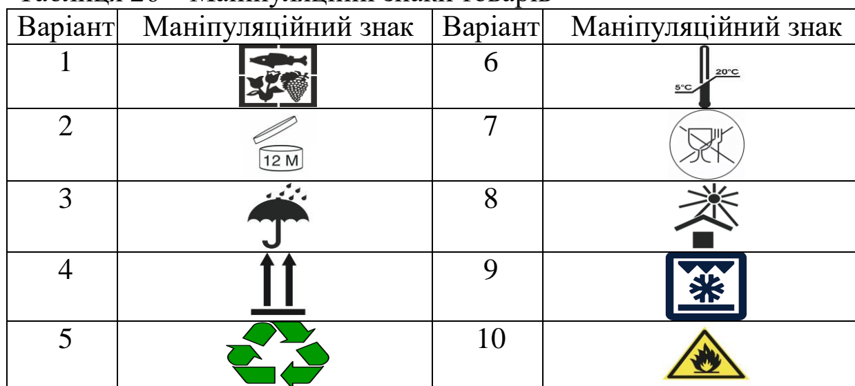
Таблиця 26 – Маніпуляційні знаки товарів

Маніпуляційний знак обрати за даними таблиці 26.