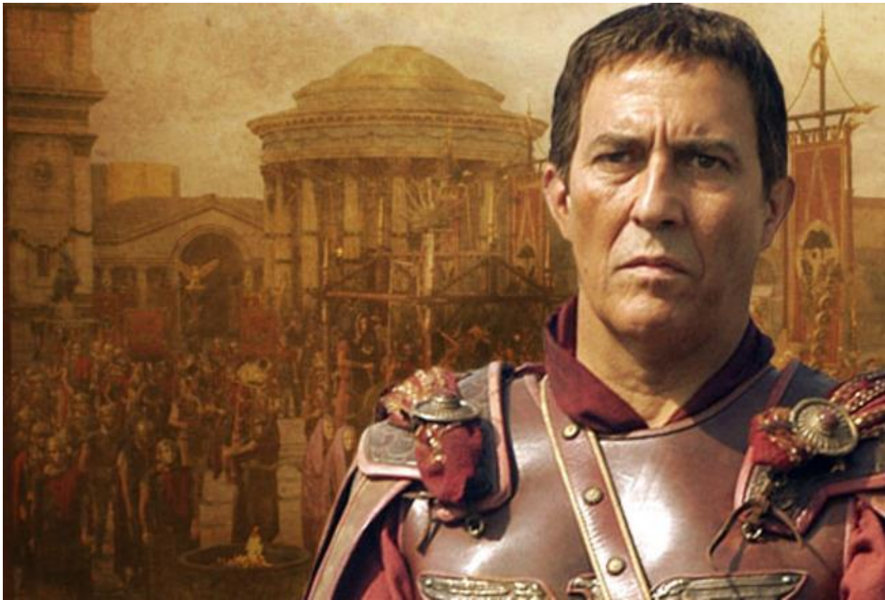
Гай Юлій Цезарь

Риторика сприяє вивченню курсу філософії, який навчає системності мислення, мовлення і поведінки. Окремі філософські дисципліни – етика, естетика, логіка – знайомлять з цінностями моралі, принципами розуміння прекрасного, законами мислення.