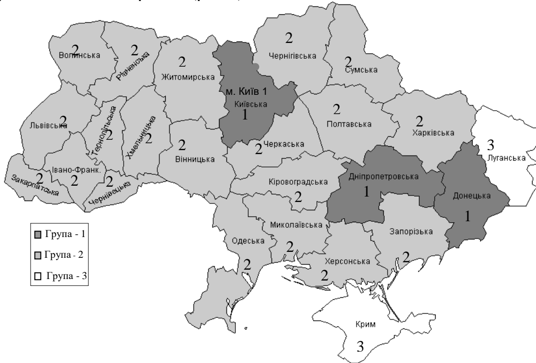
Рис. 3. Схожість впливу процесів реформування власності в регіонах України на формування доданої вартості

Для обґрунтування напрямків підвищення ефективності приватизації в Україні побудовано картосхему особливостей приватизаційного зростання регіонів України, яка наочно ілюструє результати багатомірного аналізу схожості впливу процесів реформування власності в регіонах України на формування доданої вартості (рис.3).