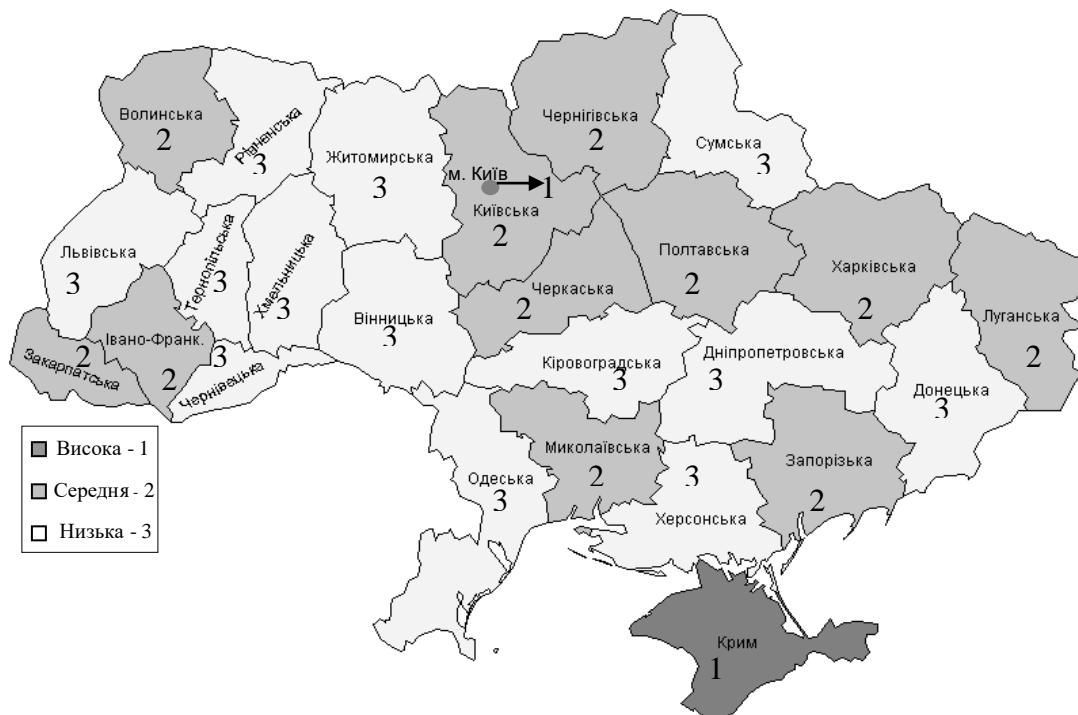
Рис. 2. Інтенсивність впливу приватизаційної активності за регіонами України на рівень створення доданої вартості

З цією метою автором за допомогою стандартного статистичного пакета Mapinfo Professional 5.0 було отримано моделі залежності обсягів виробництва доданої вартості за кожним регіоном України від обсягів приватизації об'єктів державної та комунальної власності. Отримані моделі засвідчили низьку ефективність процесів реформування власності в Україні та недостатній вплив на економічний розвиток. Для зазначених моделей були визначені вектори найшвидшого зростання, що характеризують напрямки приватизації, які забезпечать найшвидше зростання доданої вартості в регіоні. За отриманими результатами була побудована картосхема приватизаційного зростання в Україні (рис. 2).