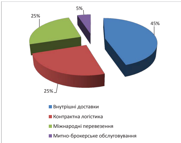
Рис. 3. Структура ринку логістики в Україні

ни і в Одесу істотно ускладнена у зв'язку із зміною кон'юнктури ринку і ускладненням умов діяльності; поставки на Схід схильні до високих ризиками безпеки, як для життя персоналу, так і для збереження транспорту і вантажів.