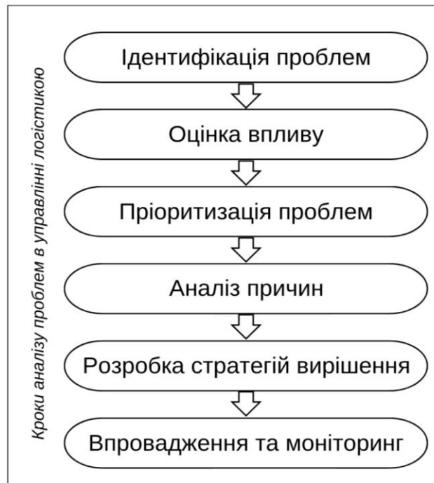
Рис. 2. Кроки аналізу проблем в управлінні логістикою