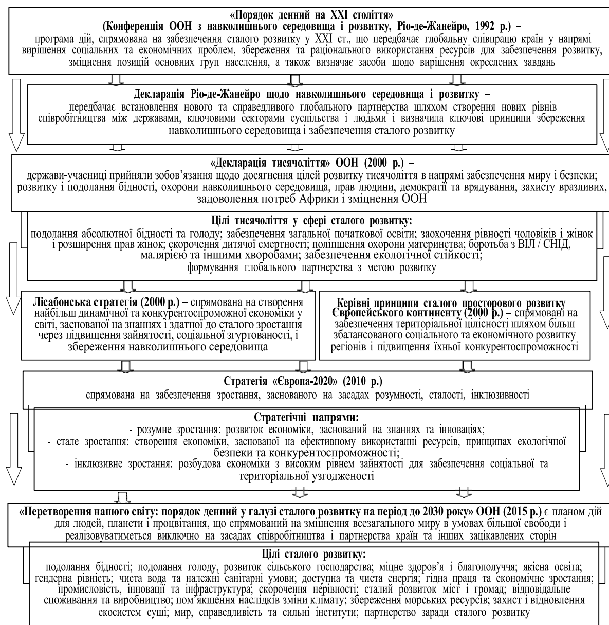
Рис. 1. Глобальні ініціативи у сфері сталого розвитку і їх відображення в національних стратегіях і програмах (сформовано авторами)

декарбонізована: вітрова та гідроенергія забезпечують 60 % потреб Швеції в енергії. Також в країні активно розвивають екологічні види транспорту. Фінляндія планує досягти кліматичної нейтральності до 2035 року і спрямовує значні інвестиції у вітрову та сонячну генерацію. Фінляндія також запроваджує сталі методи управління лісами, що вкривають понад 73 % її території, а також водними ресурсами [13].