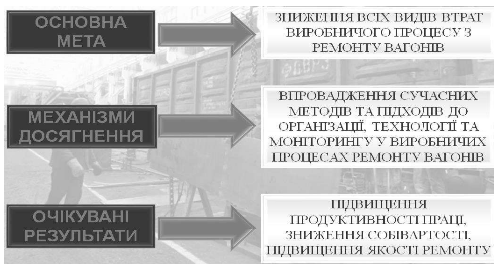
Рисунок 2 – Стратегія бережливого виробництва в умовах ВРП

Якщо аналізувати досвід використання логістичних технологій, найбільшу увагу привертає система бережливого виробництва (рисунок 2). Вона являє собою концепцію управління виробничою системою, яка заснована на неухильному прагненні до усунення всіх видів виробничих витрат.