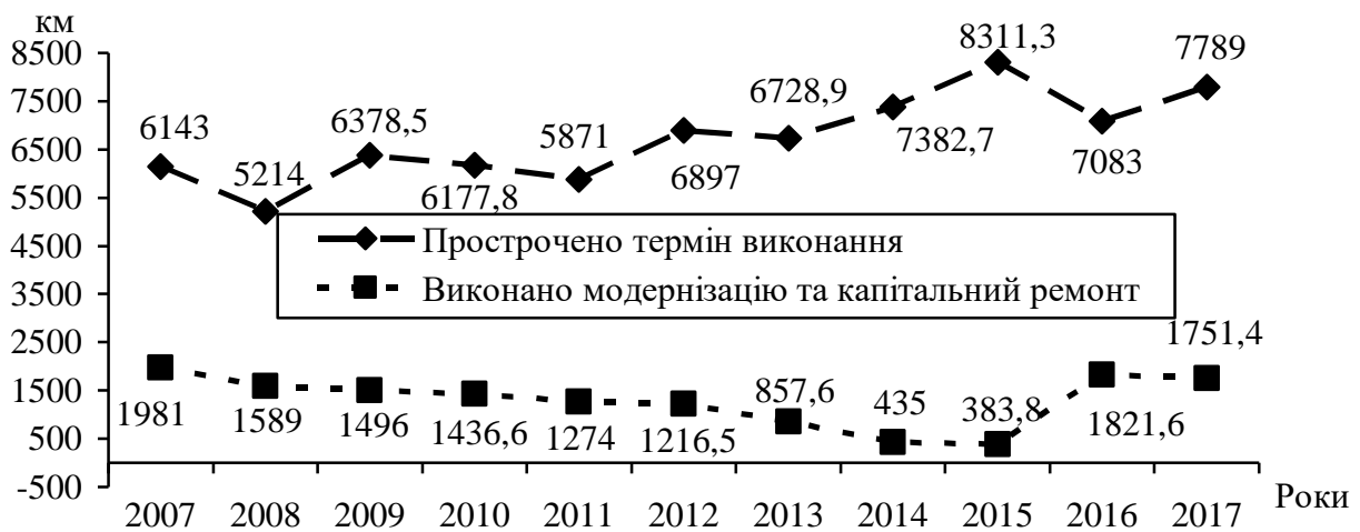
Рис. 1. Виконання обсягів модернізації та капітального ремонту колій у порівнянні з величиною прострочених кілометрів за період 2007-2017 роки (складено на основі [11-18])

Величезну загрозу для безпеки перевезень становить проблема нагромадження колій, що експлуатуються з простроченим терміном виконання їх модернізації та капітального ремонту. Зокрема, з простроченим терміном виконання капітальних ремонтів сьогодні експлуатується 27 % магістральний колій ПАТ «Укрзалізниця» від загальної їх протяжності [10]. Спостерігається тенденція наростання км колій з простроченим терміном виконання модернізації та капітального ремонту. Так, за період 2007-2017 роки у колійному господарстві ПАТ «Укрзалізниця» кількість км колій, що експлуатується з простроченим терміном модернізації та капітального ремонту збільшилася з 6143 км у 2007 році до 7789 км у 2017 році (на 1646 км або на 26,8 %) (рис. 1).