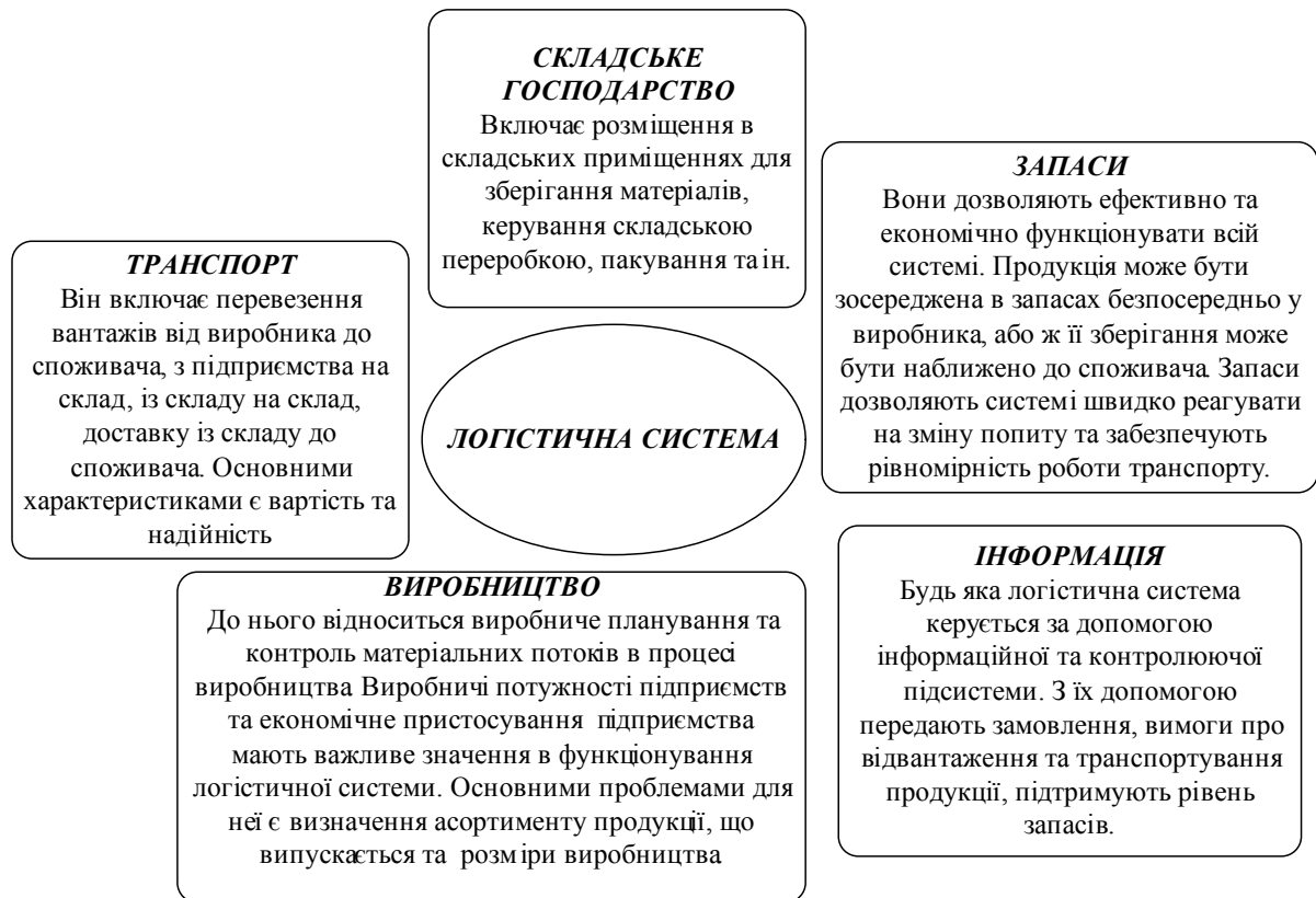
Рисунок 2 - Функціональні галузі логістичних систем

Відомо що логістика взаємодіє з процесом виробництва, як мінімум в двох напрямках: по-перше виробництво повинно регулярно поповнювати запаси готової продукції в системі розподілу і задовольняти спонтанні потреби споживачів, а по-друге – виробництво залежить від системи матеріального забезпечення сировиною, матеріалами, комплектуючими частинами в певній кількості та відповідної якості.